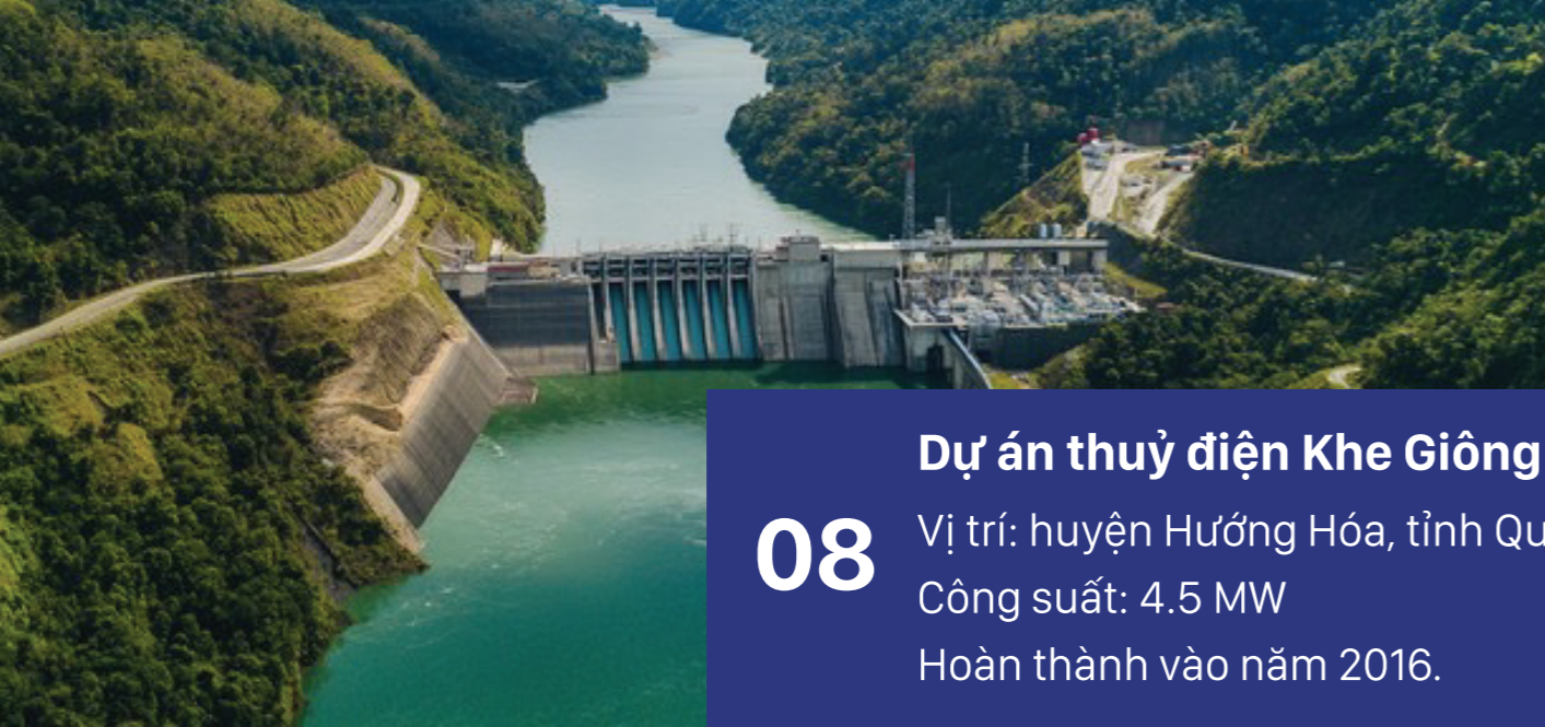
08 Dự án thủy điện Khe Giông Vị trí: huyện Hương Hóa, tỉnh Quảng Trị Công suất: 4.5 MW Hoàn thành vào năm 2016.