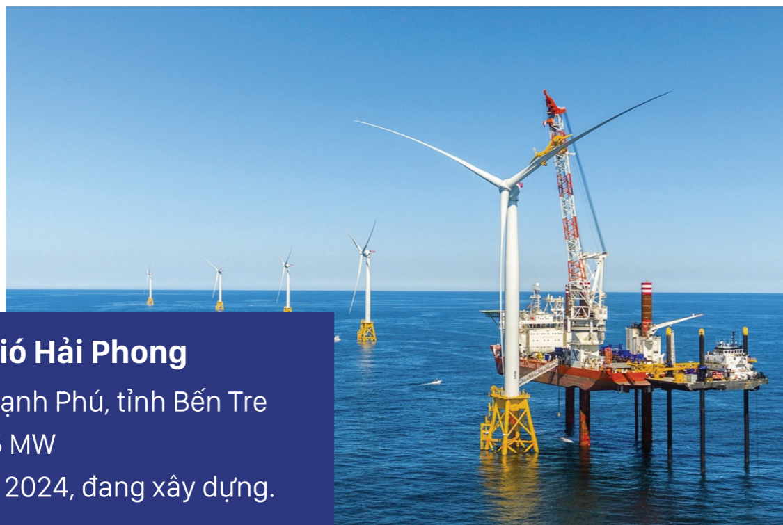
09 Dự án điện gió Hải Phong Vị trí: huyện Thạnh Phú, tỉnh Bến Tre Công suất: 435 MW Triển khai năm 2024, đang xây dựng.