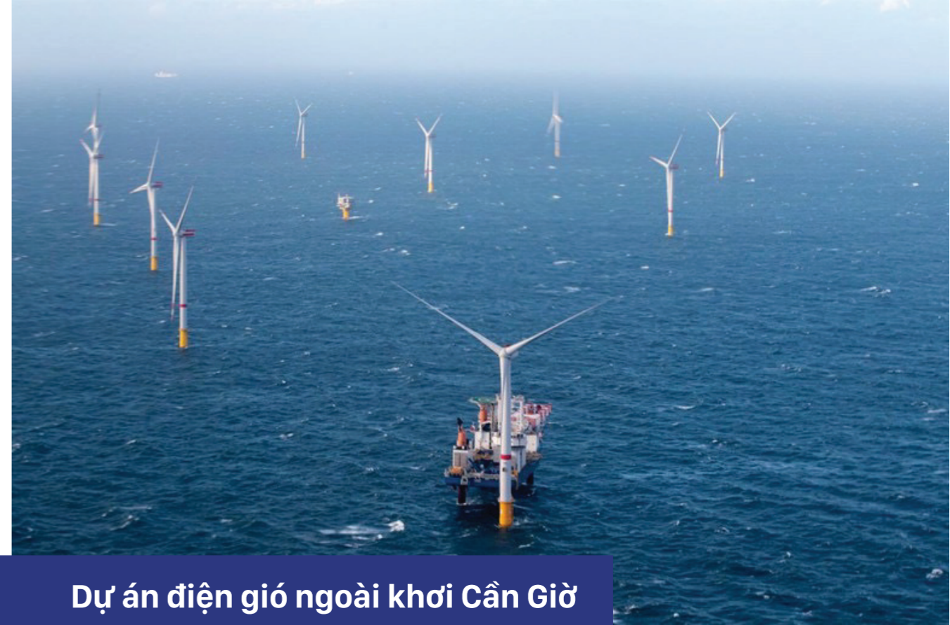
11 Dự án điện gió ngoài khơi Cần Giờ Vị trí: huyện Cần Giờ, Tp Hồ Chí Minh Công suất 1000 MW Đang đề xuất đầu tư.