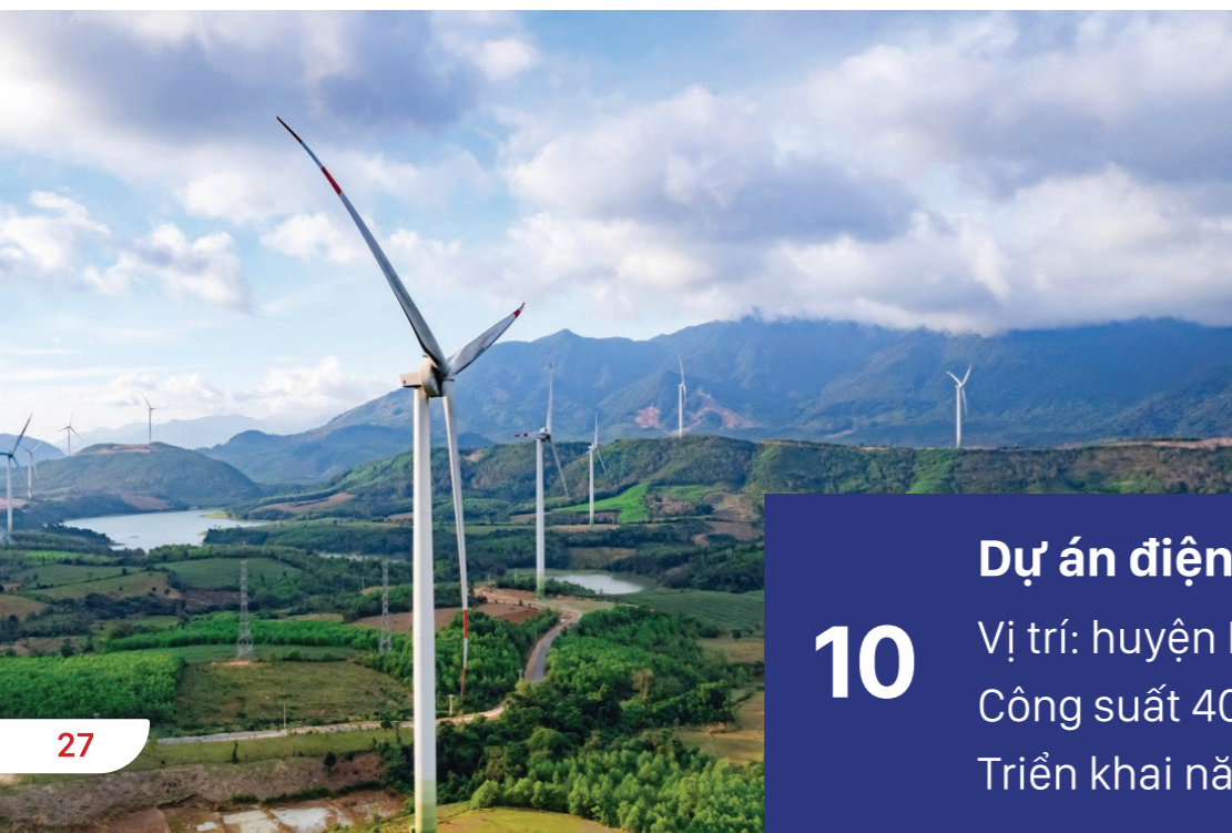
10 Dự án điện gió Ngư Thủy Bắc Vị trí: huyện Lệ Thủy, tỉnh Quảng Bình Công suất 400 MW Triển khai năm 2025.